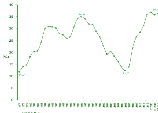
Gráfico 3: Evolución de la ocupación en Andalucía Miles de personas